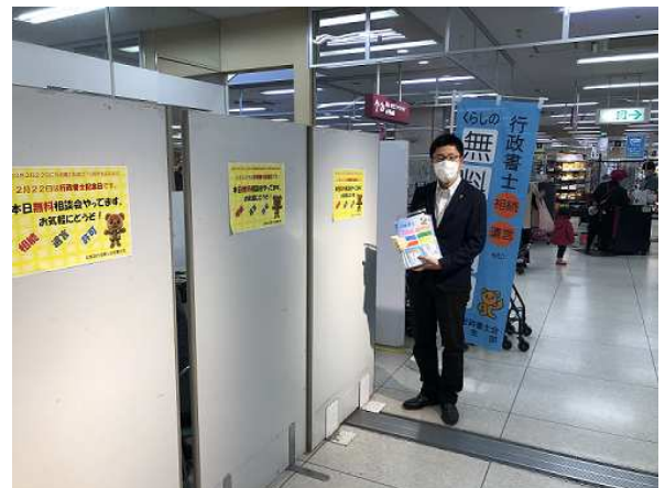
イオン伊達店にて