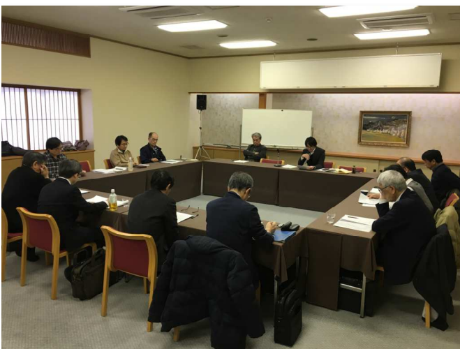
🍀 新年会研修会の様子