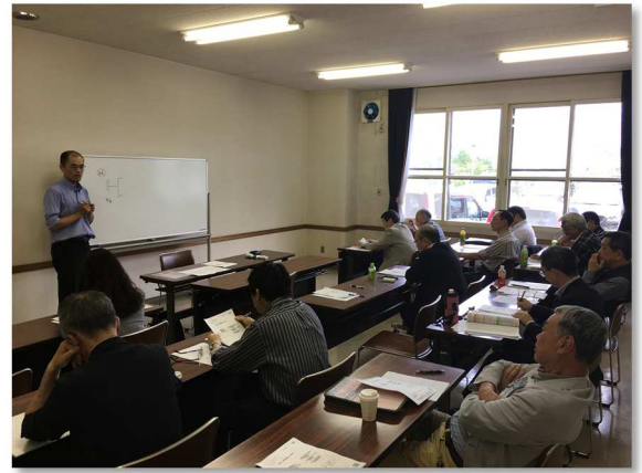
🌿 坂本会員による研修会の様子