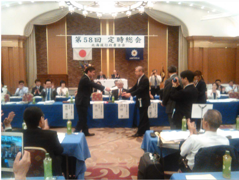
◆5月19日 第58回北海道行政書士会定時総会(於札幌)の様子