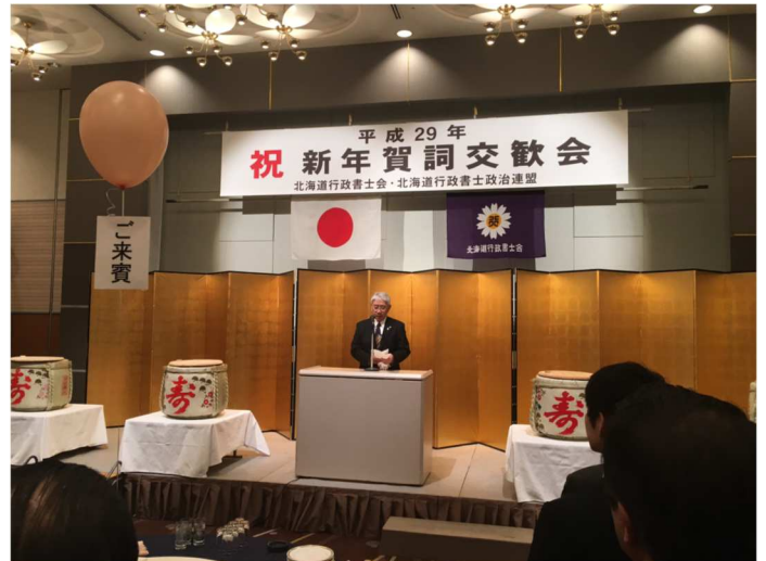
・冒頭のあいさつをする北海道行政書士会の吉村会長