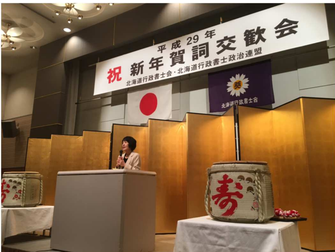
・来賓の高橋はるみ知事