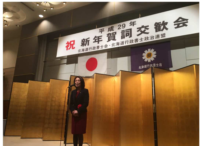
・来賓の徳永エリ参議院議員