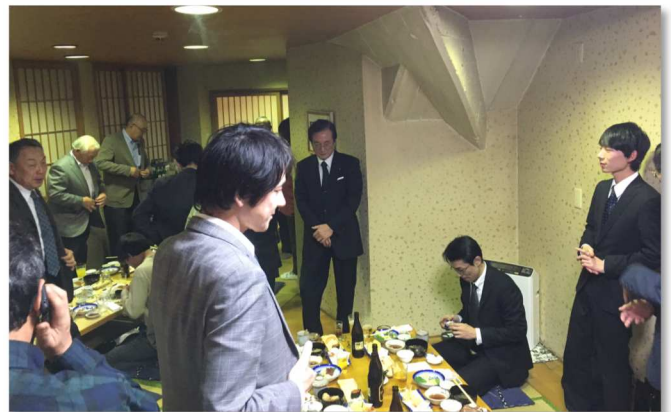
※11月5日開催研修会(小樽)の懇親会の様子