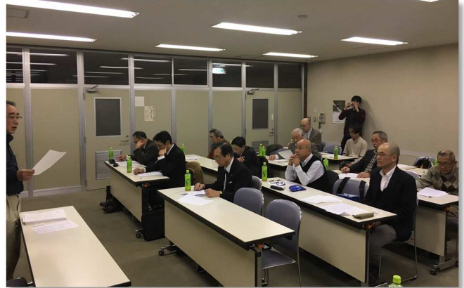
※11月5日開催研修会(小樽)の様子