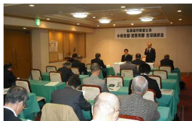
※11月28日開催 研修会の様子